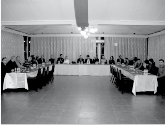
Kdz. Ereğli İlçe Temsilciliği