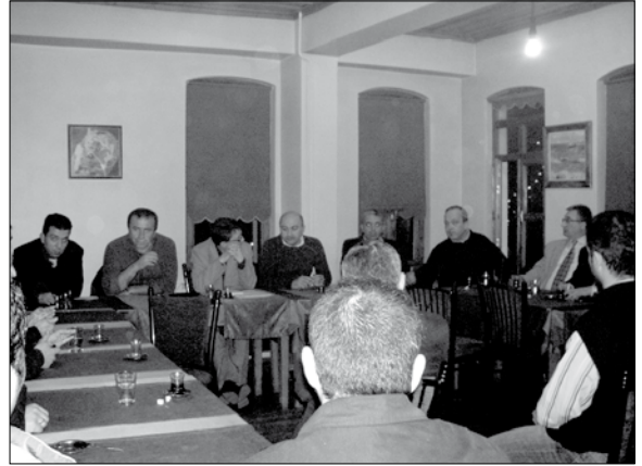
Bartın İl Temsilciliği

Şube Yönetim Kurulumuzca İl/İlçe Temsilcilik Yürütme Kurulları aşağıdaki şekilde görevlendirildi.