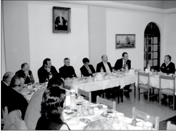
Kastamonu İl Temsilciliği

24 Şubat 2010 tarihinde Kdz. Ereğli İlçe Temsilciliğimizde, 27 Şubat 2010 tarihinde Karabük ve Kastamonu İl Temsilciliklerimizde ve 4 Mart 2010 tarihinde Bartın İl Temsilciliğimizde, üye eğilim belirleme toplantıları yapılarak üyelerimizin sorunları tartışıldı, Temsilcilik Yürütme Kurullarına aday olmak isteyenler belirlendi.