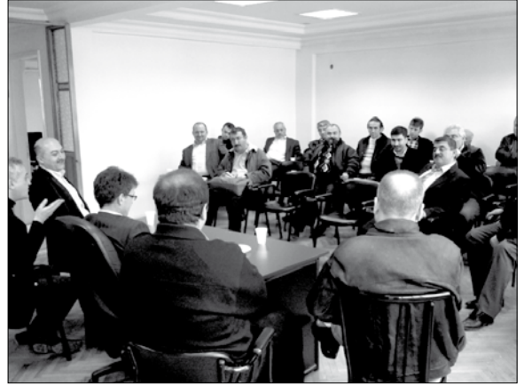
Karabük İl Temsilciliği

24 Şubat 2010 tarihinde Kdz. Ereğli İlçe Temsilciliğimizde, 27 Şubat 2010 tarihinde Karabük ve Kastamonu İl Temsilciliklerimizde ve 4 Mart 2010 tarihinde Bartın İl Temsilciliğimizde, üye eğilim belirleme toplantıları yapılarak üyelerimizin sorunları tartışıldı, Temsilcilik Yürütme Kurullarına aday olmak isteyenler belirlendi.